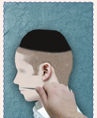
אין להוריד את השפם בתער

התמונות היו למראה עיניהם של מרן הגר"ח קנייבסקי שליט"א ומרן הגר"נ קרליץ שליט"א