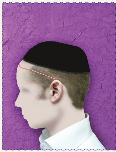
מי שיש לו קרחת - יש לחשב את גובה הפאות, מאותו מקום שהיה לו שער בתחילה