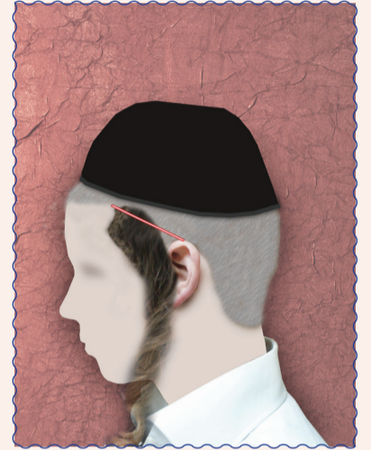
תספורת של פאות שיש בה איסור של בל תקיף