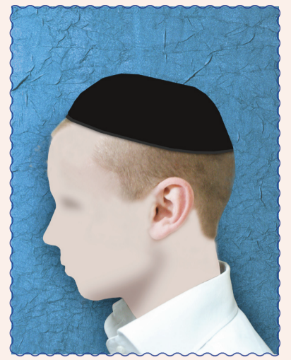
המוריד פאות הראש עובר בב' לאוין, לכן במקום הפאות יש להניח שער באורך של חצי ס"מ, האיסור גם אם מסיר ע"י מספרים