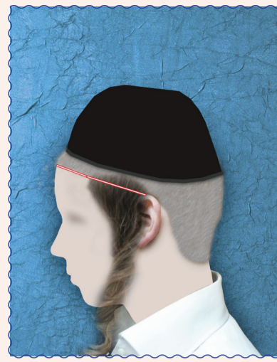
איזור פאות הראש הוא לפי הסימון שבתמונה