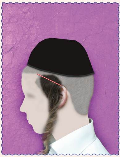
תספורת של פאות שיש בה איסור של בל תקיף