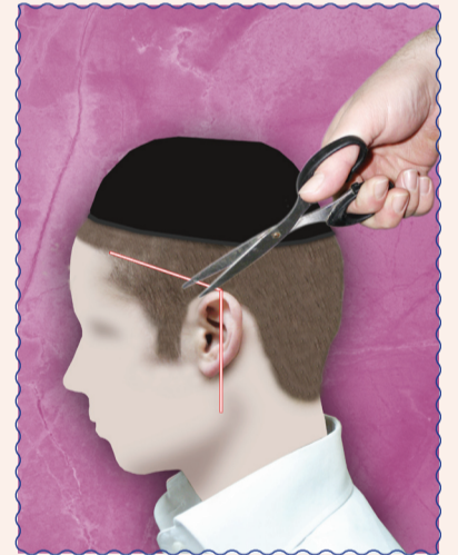
אין להסתפר עם מספרים מעל האוזן ממקום הגבוה שבאוזן לכיוון הפנים, דקשה לזהר שלא יגזור שערה באופן שלא ישאר בה חצי ס"מ

שו"ע סי' קפ"א י"א - פאות הזקן הם ה' ורבו בהם הדעות לפיכך ירא שמים יצא את כולם ולא יעביר תער על כל זקנו כלל