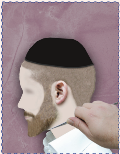
אין לגלח בתער אף בגרון