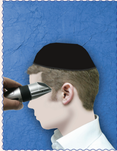
בגילוח צידי הפאות מעל העצם עובר בבל תקיף