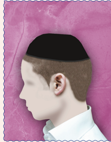
בגילוח הפאות לדקות מעל העצם עובר בבל תקיף