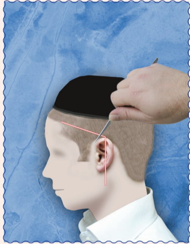
אסור להעביר תער מעל האוזן ממקום הגבוה שבאוזן לכיוון הפנים