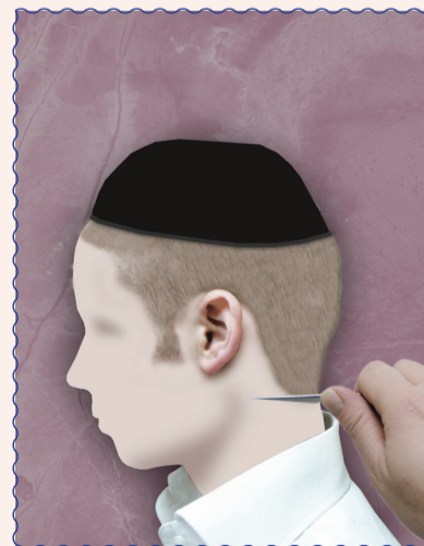
מותר להעביר תער בעורף מאחורי הראש