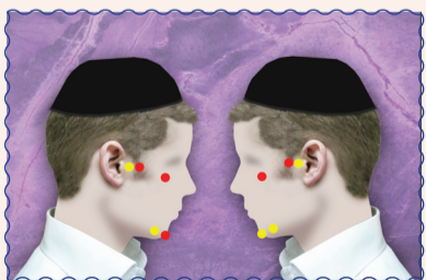
חמש מקומות של פאות הזקן לדעת רש"י בשבועות באדום, ולדעת רש"י המובא ברא"ש במכות בצהוב

שו"ע סי' קפ"א י"א - פאות הזקן הם ה' ורבו בהם הדעות לפיכך ירא שמים יצא את כולם ולא יעביר תער על כל זקנו כלל