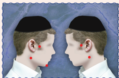
חמש מקומות של פאות הזקן לדעת הרמב"ם