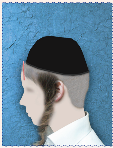
במקרה שבתמונה אזור הפאות מתחיל כמצוייר בתמונה (אך מותר לגלח באופן שנשאר באורך השערות חצי ס"מ)