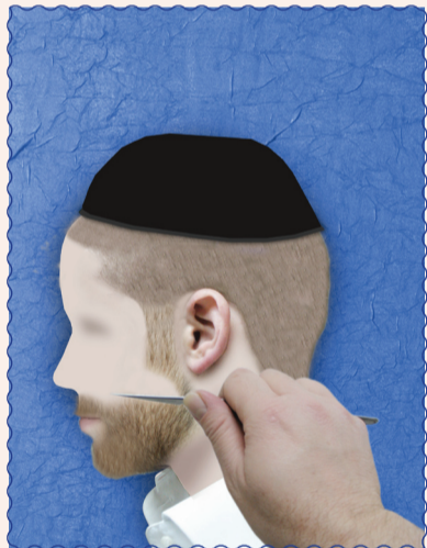
אין להוריד זקן בתער, והמוריד עובר בחמשה לאוין