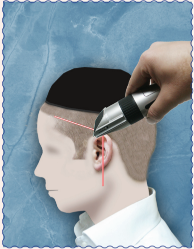
אין להעביר מכונה עם מספר נמוך (באופן שאין נשאר חצי ס"מ) מעל האוזן ממקום הגבוה שבאוזן לכיוון הפנים