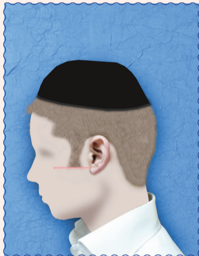
יש מחמירים להשאיר את הפאות עד היכן שתנוך האוזן מתחיל להפרד