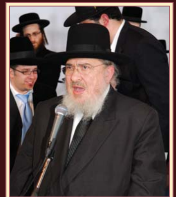
הגרמ"מ אזרחי שליט"א ראש ישיבת עטרת ישראל, נואם