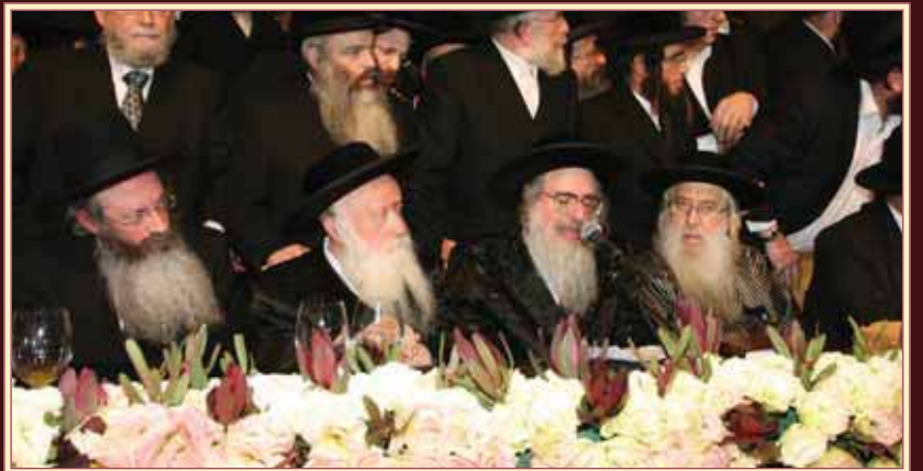
כ"ק אדמו"ר מצאנז-קלויזנבורג ארה"ב שליט"א, נואם הכבוד