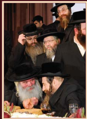
האדמורי"ם מראכמיסטריווקא וקרעשטניף-ארה"ק שליט"א ביים מעמד