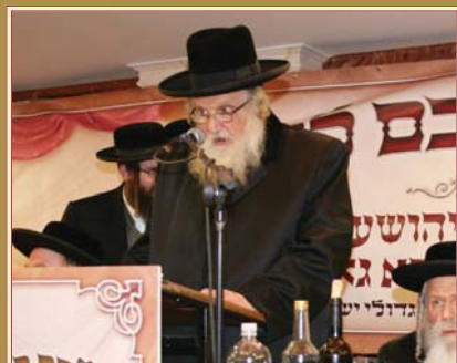
כ"ק גאב"ד ירושלים ובית דינו, ביים מעמד צאתכם לשלום שע"י עוז והדר - ג' וארא תשס"ח לפ"ק