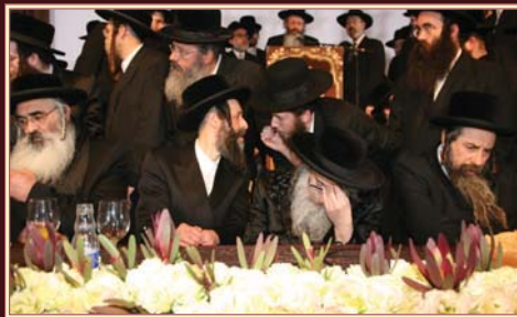
כ"ק אדמו"ר מדושינסקיא שליט"א באשיינט דעם מעמד