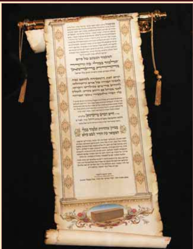
אות הוקרה לפטרוני ש"ס עוז והדר - מהדורת פריעדמאן