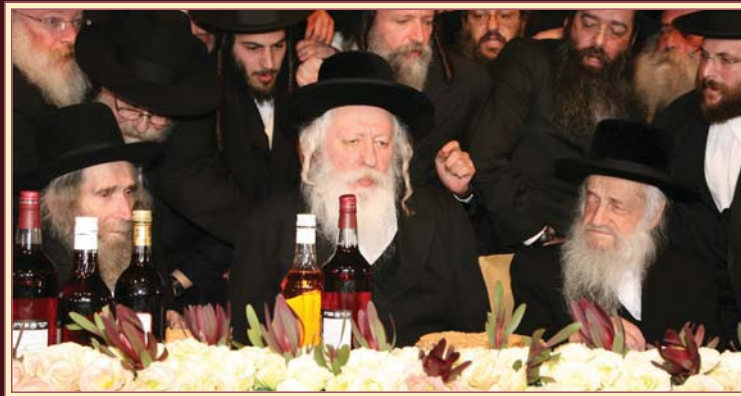
גדולי התורה והחסידות מסובין