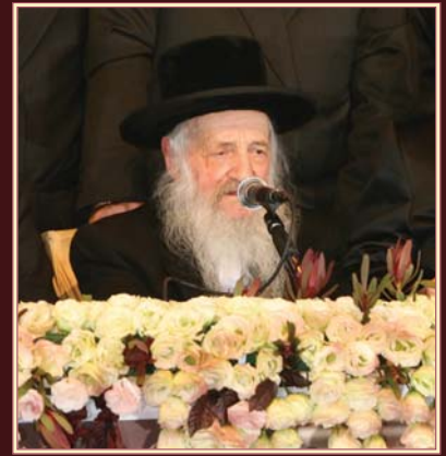
פוסק הדור הגר"ש וואזנער שליט"א איז משמיע דעם דבר ה'