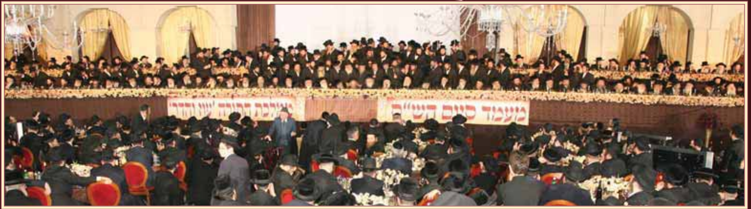
בהתאסף ראשי עם יחד שבטי ישראל