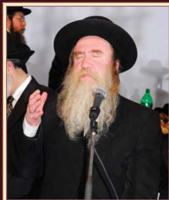
הרב מרדכי גראס שליט"א, גאב"ד 'חניכי הישיבות', נואם