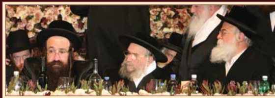
ווערט געזען צווישן אנדערע: כ"ק האדמורי"ם מטשאקאווע וספינקא-ב"ב שליט"א