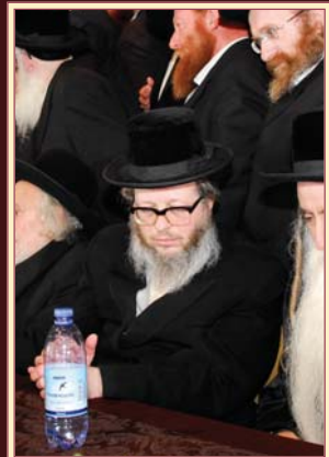
ווערט געזען: אדמו"ר מבעהוש שליט"א, באשיינט דעם מעמד

טייל פון די 1500 ספעציעל-געלאדענטע נדבנים און לומדי ואורחי מכון "עוז והדר" ביים גרויסארטיגן מעמד