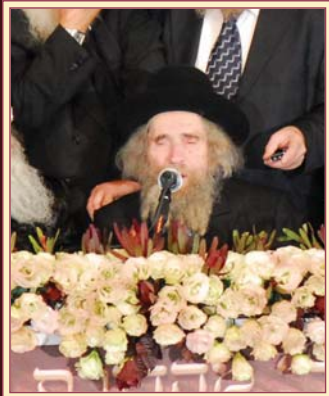
ראש הישיבה הגאון הגדול רבי אהרן לייב שטיינמאן שליט"א נואם