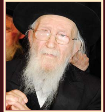
הגאון הגדול רבי מיכל יודא ליפקוביץ שליט"א, ר"י פוניבז' לצעירים, נואם