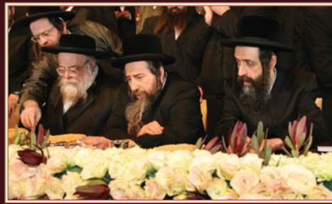
כ"ק אדמו"ר מתולדות אהרן שליט"א באשיינט דעם מעמד