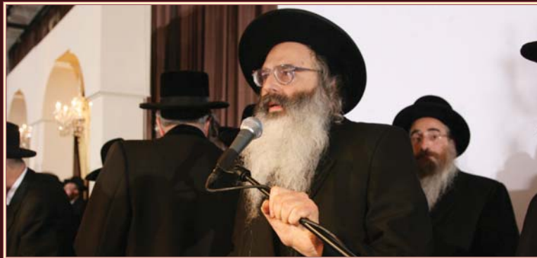
הגאון הצדיק רבי חיים יוסף דוד ווייס שליט"א, מגדולי רבני אייראפע ודומ"ץ סאטמאר באנטווערפן