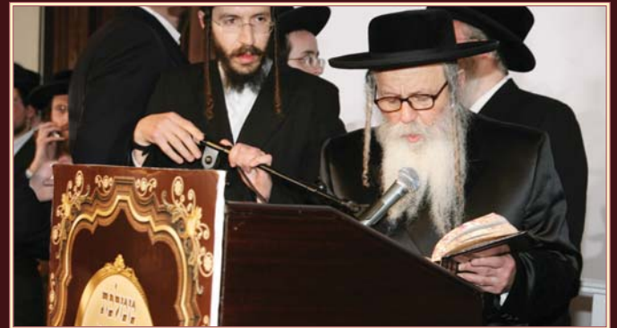
כ"ק אדמו"ר מטעמעשוואר שליט"א מאכט דעם סיום הש"ס