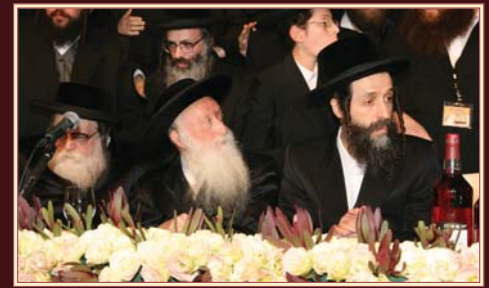
כ"ק אדמו"ר מתולדות אברהם יצחק שליט"א באשיינט דעם מעמד