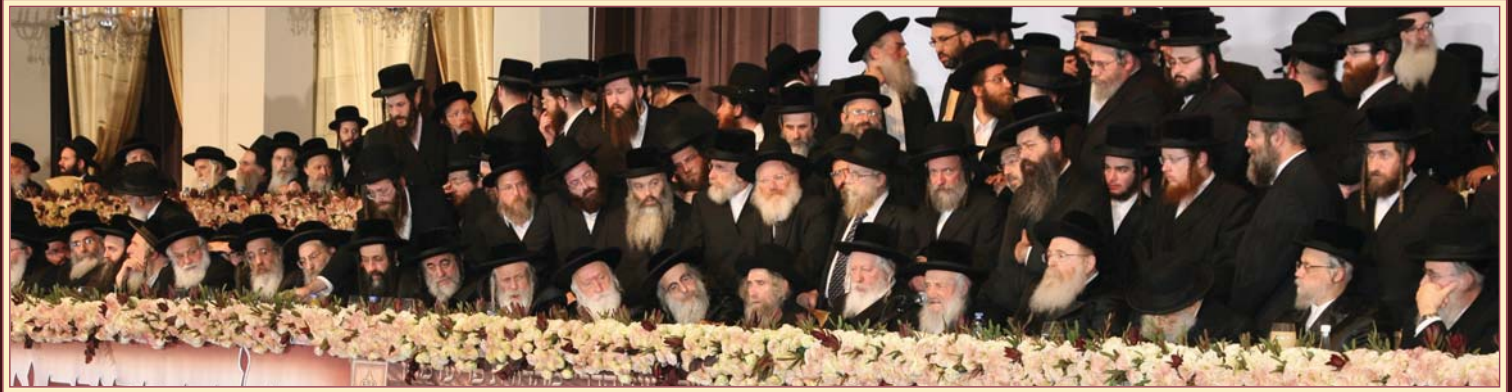
בימת הכבוד של מרגן ורבנן שליט"א