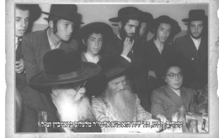
שבת צדיקיא, יום הילולא פאטער זיע"א

מלכא אין לנו רשות לשנות מאומה כלשהו מלשוננו הק', אם ברעונכם, נשוב אליו לטעמו את חוות דעתו ע"כ, אבל לנו אסור להוסיף או לגרוע בדבריו, ואפי' להויעל". רבינו זיע"א בעצמו הי' מספר לעתים זה המעשה: בשב"ק פר' עקב תשי"ז, הובל הרה"ק ר"א מבעלזא לביה"ח שערי צדק בירושלים. הרופאים עדיין לא אמרו נושא, והיה נראה שמעבד התייצב. במוציא שב"ק, הגיע מרו לאמו"ר זיע"א מתל אביב לשהות בשעות אלו על יד מלתו. כשראה שהמבצע השתפר נצט מביה"ח, אך מטעם הכחוס עמו חוה על עקביו, וביקש להיכנס שוב לביה"ח. אך הפעם כבר הי' השער סגור על נעל ובריה, והאחיות לא רצו לפתוח לנו. משריאתי כי מסורים לפתוח הדלתות לאבי הק', לא היסטתי לרגע, והנחתתי זרועי בחזקתה על הדלת הזכוכית כשאר קד כחוט השערה הפריד בין רבינו למנונית. מרו מוהרמ"מ זיע"א לא הסתיר את תודתו לבנו, ואף התבטא אז: "עם איז מיר נישט געווען אן חידוש אין מיין אלתרל זאל זיך מוסר נפש זיין פאר מיר" אין זה חידוש עבורי בשב... יחסות נפשו עבורי. ובאותו מעמד ביך אותו בברכות קדושות ונעלות מעומק לבו הסתור. כאשר נבצר ממרו הרמ"מ זיע"א לנסוע לאיזה מקום