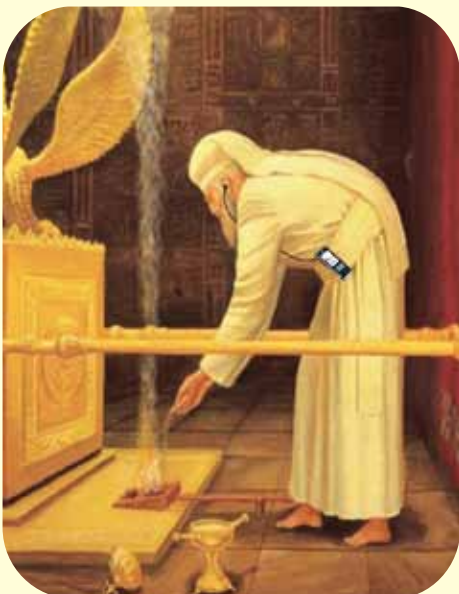
צלם בהיכל • ו"קרה היא מכה"ג שנכנס לפני ולפנים".

בחורים יקרים, בחורים אהובים. הצילו! הצילו! תזרקו את הכלי המשחית הזה מקרבינו. קדשו שם שמים! גם מי שהוריו מתקשרים מאמריקה לכאן או אפי' לפני לידה יש עינות. אם רוצים אפשר, וכמו שהתחלתי שאם יודעים שמונחים כאן את יון הרשעה, יעשו כל מה שאפשר ללא שום תירוצים!