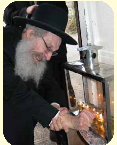
צלם אלוקים • העמל ברחוב העמלים

שיחה זו שנאמרה מנהמת ליבו של מרן רה"י זצוק"ל לפני מס' שנים, על אף ירידת הדורות עדיין מהדהדת בהיכלי התורה ובליבות השומעים. וכיון שהצדיקים מסתלקין בעוון הדור, מי יודע אם ידינו לא שפכו וכו'.