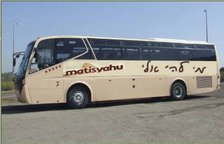
מאי חנוכה. בדורינו גם המתיוונים מדליקים נרות חנוכה ועושים פרסומי ניסא.

בחומר, הנראה בעיני בשר והמורגש בחמשת החושים. ואוי למאמין רק במה שהוא רואה שאז את שכלו, גם הרי איננו רואה. וראו גם ראו את רשעותם של היוונים. "וחושך על פני תהום זו יוון שהחשיכה את ישראל בגזרותיה" (ב"ר). כל זמן שביהמ"ק על תילו והעבודה בו קיימת והמנורה הטהורה דולקת בשמן טהור בתוך הקודש, עם ישראל כולו מואר בנר מצוה ותורה אור. ואז כל ישראל מסוגלים לראות לאור הגדול הזה, מסוף העולם ועד סופו. כל נביא או חכם העדיף מנביא, יודע ורואה בשמים ממעל ועל הארץ מתחת. קטן שבתלמידי רבי מחייה מתים. נהירים שבילי רגיעא לשמואל כשבילי דנהרדעא. הרבה לפני גלילאו גלילי מציא הטלסקופ. באים היוונים, ובטומאתם, טומאת הגוף והחומר, מטמאים את כל החוכמות והשמנים. וכך מכבים את האור ומשרים חושך בעולם. ואח"כ באים המחשיכים בעצמם וממציאים לנו כלים לראות בחושך. וכל דור באים ברגל גאווה עם מכשיר חדש המשוכלל יותר להארת החושך שהם עצמם גרמו. ואז התגאו בגאונותם - אנו המפתחים והממציאים, אנו המדענים