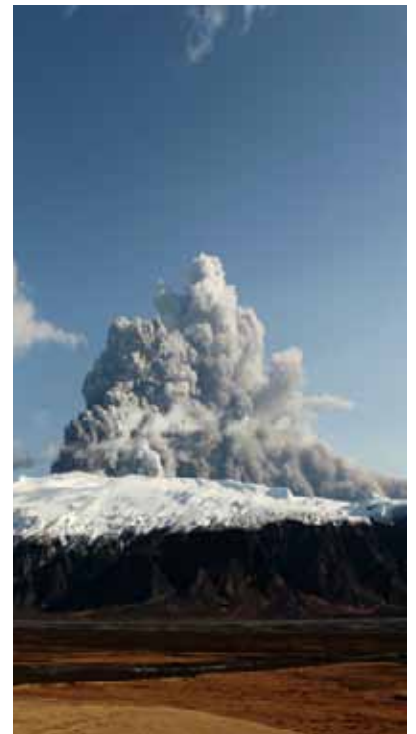
התפרצות הר געש באיסלנד, תשע"א