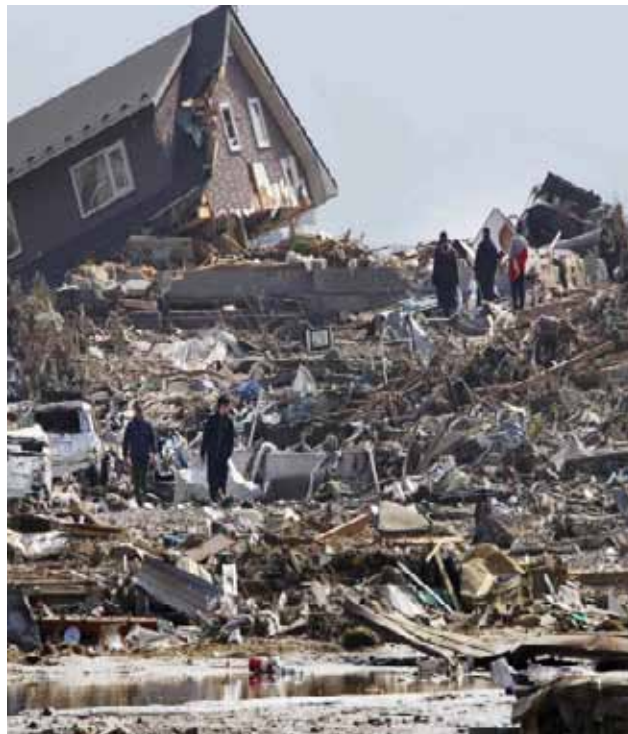
רעידת אדמה ביפן, אדר תשע"א