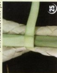
24 הקו חזק