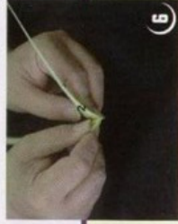
1 קפל עלה 2 על עלה 1

נמסר ע"י אחד מדבני ועד הרבנים שליט"א בהסבירו שכך היו עושים בדורות שעברו אלא שבזיק העתים והזמנים נשכחו חלק מהשלים, הציבור יודע שלב הראשון, ואינו יודע היטב שלב השני