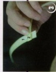
4 תקבל תוצאה כזאת