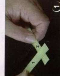
7 תקבל צורה זו