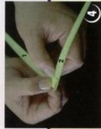
3 קפל בליטת עלה 1 על בליטת עלה 2