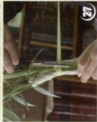
22 גזור את שארית העלים