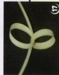
18 יתקבל מצב שתי טבעות צמודות