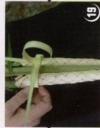
16 גזור את שארית העלים