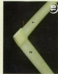
11 תקבל צורת ד'