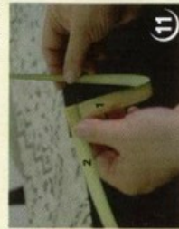
10 החזק בעלה 1 ועגל אותו לכיון הלולאה