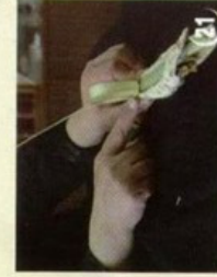
28 החזק בעלה 2 ועגל אותו לכיון הלולאה