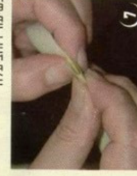
14 החזק בעלה 2 ועגל אותו לכיון הלולאה