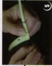
2 תקבל צורה כזאת