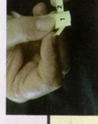
5 קפל בליטת עלה 2 על עלה 1