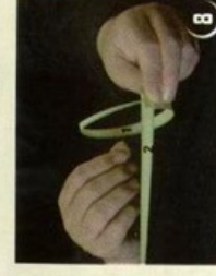
13 הכנס את קצה עלה 1 לחתך הלולאה שנוצרה