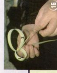
19 משך עלה 2 עד לקבלת טבעת נוספת