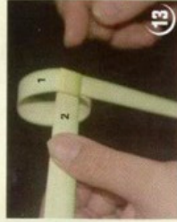
8 תקבל טבעת כזו