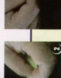
6 שים עלה 1 מעל עלה 2 באופן שילוטו משני הצדדים כשעור רחב עלה