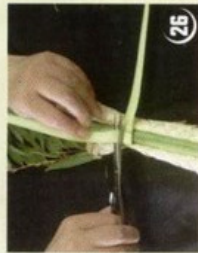
23 תקבל טבעת סגורה ומהודקת בחזקה על הלולב ומיני