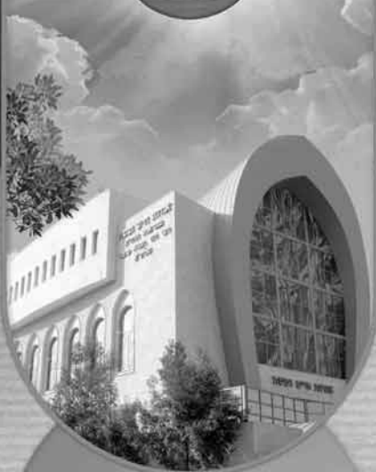
ירושלים תל אביב חיפה באר שבע